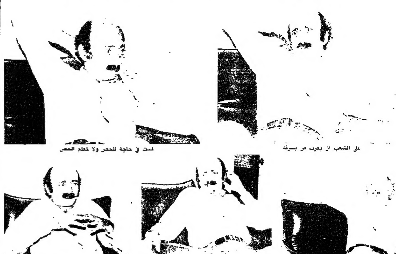
على الشعب ان يعرف من يشرق